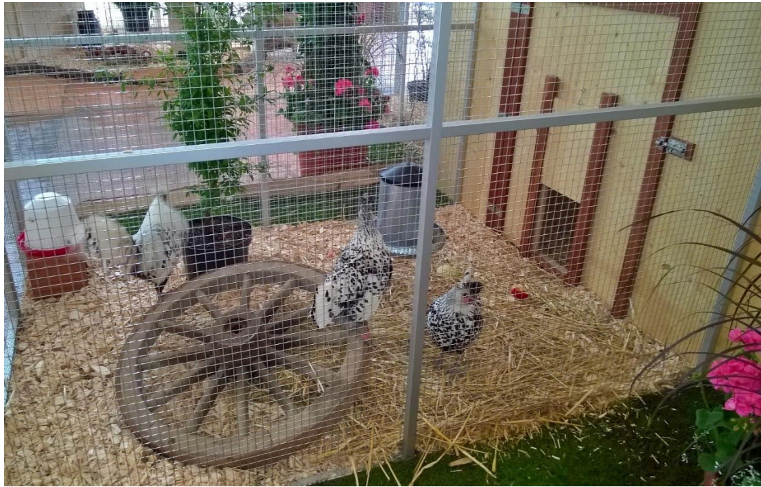
Zufriedene Tiere – erfreute Besucher....