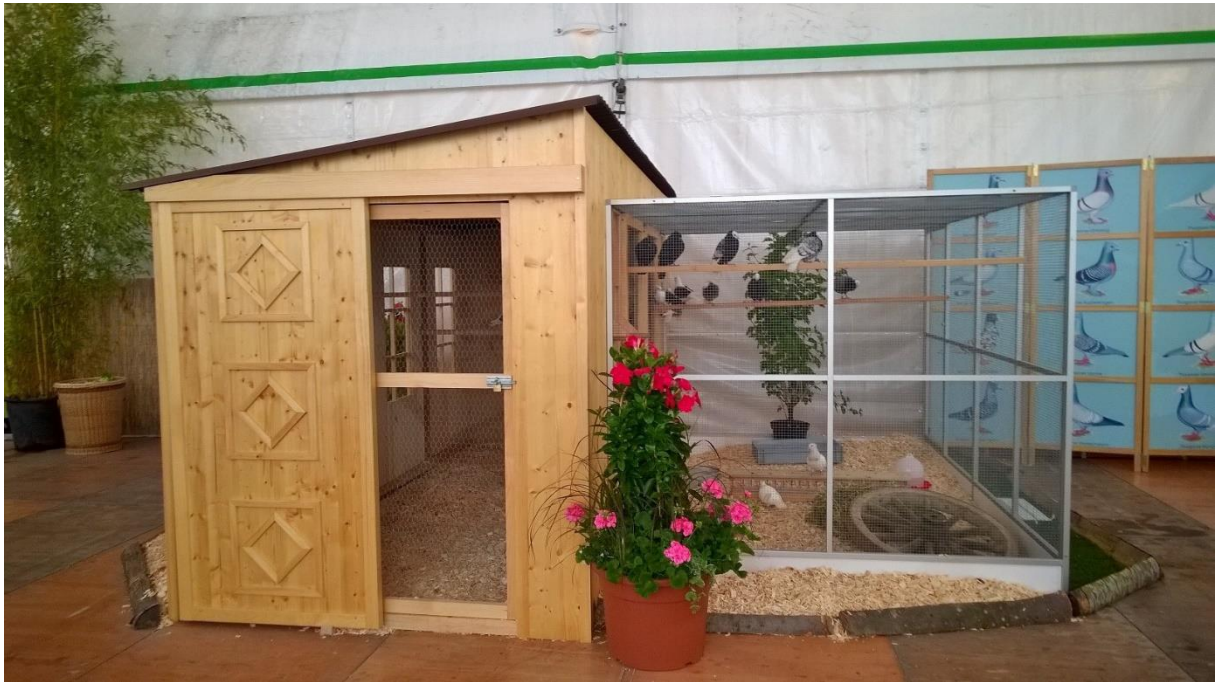
Den Tauben hat's gefallen....