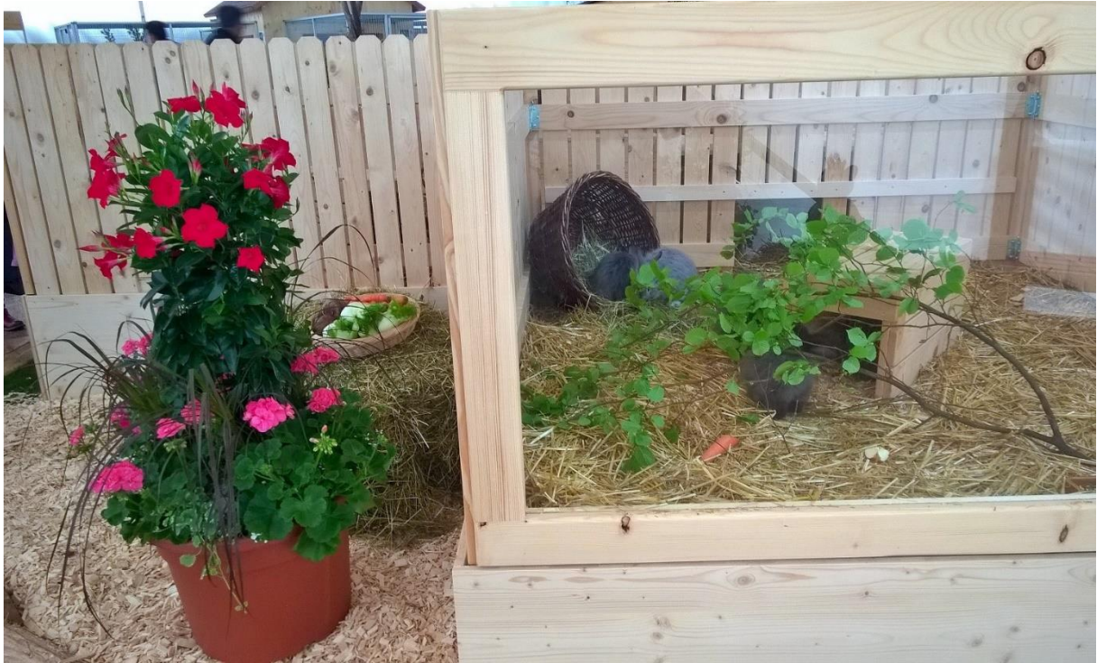
Die Kleinsten liessen sich nicht stören....